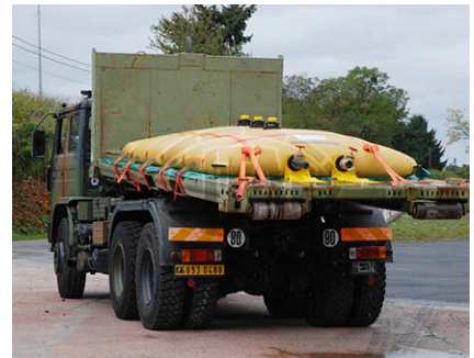
Transportzisterne auf Fahrzeuganhänger