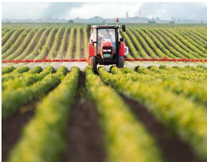
Wasserspeicher für die Landwirtschaft