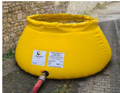
Offenes Becken, z.B. für Löschwasser