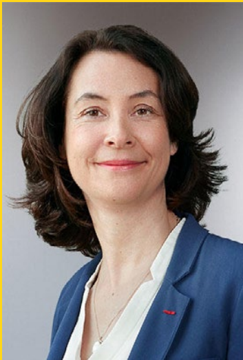
Estelle Brachlianoff CEO von Veolia

Im Einklang mit ihrem Unternehmenszweck, den sie am 18. April 2019 beschloss, legt die Unternehmensgruppe Veolia besonderen Wert darauf, an allen Standorten für die ihr eigenen Werte, die jeweiligen nationalen Rechtsvorschriften und die von internationalen Organisationen empfohlenen Verhaltensregeln einzutreten. Sie setzt alles daran, die Anerkennung dieser Werte nachhaltig zu fördern.